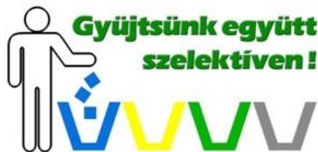
Hulladékgyűjtő edény azonosító MATRICA

FONTOS: Kérjük, hogy a jelezze lomtalanítási igényét, és csak a lomtalanítás körébe tartozó hulladékokat készítse ki az előre egyeztetett időpontban.