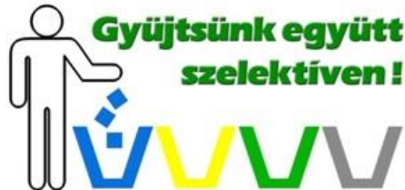
Hulladékgyűjtő edény azonosító MATRICA

FONTOS: Kérjük, hogy a jelezze lomtalanítási igényét, és csak a lomtalanítás körébe tartozó hulladékokat készítse ki az előre egyeztetett időpontban.